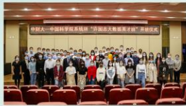
首届“许国志大数据英才班”开班仪式