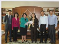
▲ 中财史蒂文斯项目签约仪式

学院积极开展国际化引智，2019年与史蒂文斯理工学院商学院合作举办新技术与新经济国际学术研讨会，连续多年获批教育部万人计划奖励资助并成功开展港澳与内地高等学校师生交流计划项目，与史蒂文斯理工学院合作举办的企业项目管理硕士项目获得国际教育协会(IIE)安德鲁·海斯凯尔奖的提名。