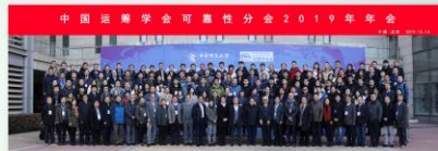
● 中国运筹学会可靠性分会2019年年会

学院加大力度,积极邀请海内外知名学者来学院举办学术讲座及学术交流,平均每年举办20余场高水平学术交流活动,学者来自美国加州大学洛杉矶分校、美国宾夕法尼亚州立大学、俄罗斯圣彼得堡理工大学、澳大利亚墨尔本皇家理工大学、澳大利亚科廷大学、希腊色萨利大学、法国巴黎金融协会等海外高水平大学及科研机构。此外学院举办了第十一届中国项目管理大会、第十届国际应急管理理论暨中国(双法)应急管理专业委员会第十一届年会、“一带一路”建设中的投资管理研讨会(2018)、新技术与新经济国际学术研讨会、中国运筹学会可靠性分会2019年年会等多项高水平学术会议,有效提升了学院的学术影响力。