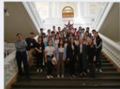
▶ “一带一路”沿线国家访学