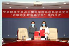
中央财经大学与中国科学院系统科学研究所 “许国志大数据英才班”签约仪式

“许国志大数据英才班”依托大数据管理与应用专业，由学校与中科院系统所联合举办，首届本科生于2020年9月入学。“许国志大数据英才班”将中国科学院系统所的智力资源和科技资源引入本科生培养过程，使大数据管理与应用和财经商务交叉融合领域的育人实力和竞争实力显著增强，大数据、管理、金融、经济相结合的办学特色逐步形成。“许国志大数据英才班”致力于培养能够引领未来行业发展的金融大数据、经济大数据和企业管理大数据领域的顶尖人才。