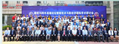
● 新技术与新经济国际学术研讨会