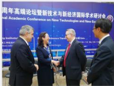
▲ 新技术新经济国际学术研讨会